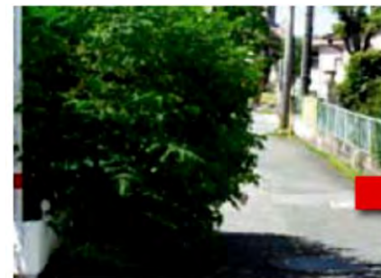
樹木が覆い見通しの悪い危険な道路も…