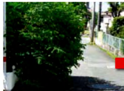
樹木が覆い見通しの悪い危険な道路も…