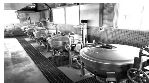
◆揚げ物、煮物の大なべがひしめく調理場内

保健所による検査でも、室内温度の面で基準をクリアしたことがないとのこと。「市も検査の結果は当然把握しているはず。民間の調理場やレ