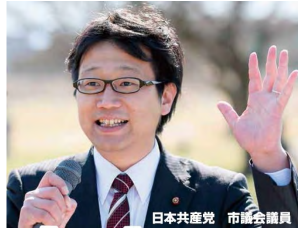
日本共産党 市議会議員